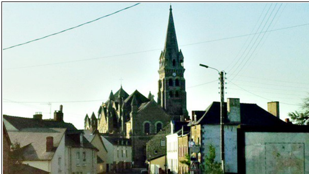
Photo prise en fin de journée de l'église de Tinteniac. Les fils électriques donnent une certaine perspective de l'église.

Radio-camping-car-facetedebouc 17 août 2015 21h 26 En hommage à Jean Paul Olivier, l'église de Tinteniac