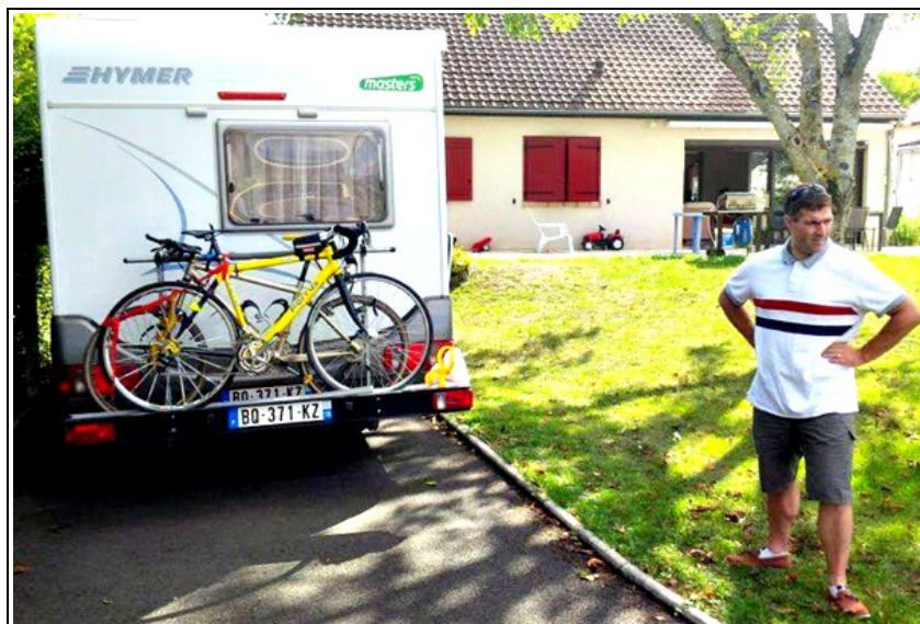
Les bécanes sont bien arrimées au camping car.

Surtout, ne pas oublier le nécessaire à pédaler pour accomplir l'exploit, les bécanes (oui, il en faut deux, au cas où.....).