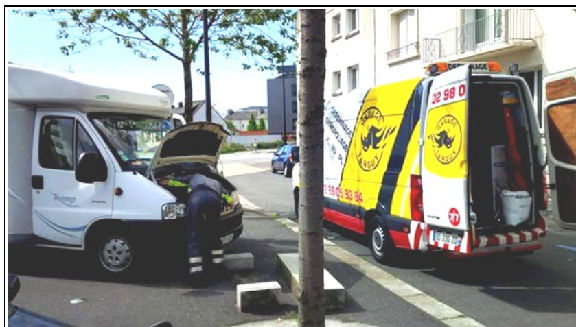
Le loup-réparateur Tanguy en recherche de la panne. Zorro est sauvé, bien plus rechargé en énergies