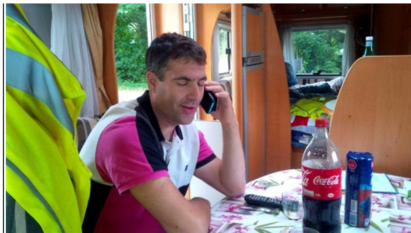
La joie de partir se lit sur le visage de l'impétrant....