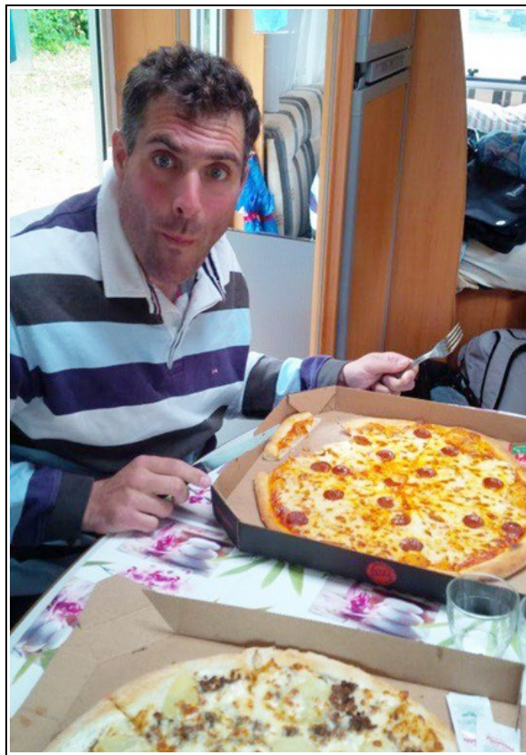
La surprise du chef coach à son poulain