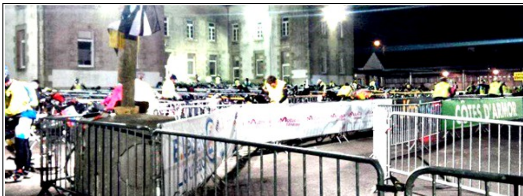
Une scène de parage de randonneurs, comme sur un foirail à bestiaux

« Contrôle de Loudéac, 2h du mat et encore et toujours de l'activité! »