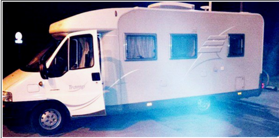
Camping car côté gauche