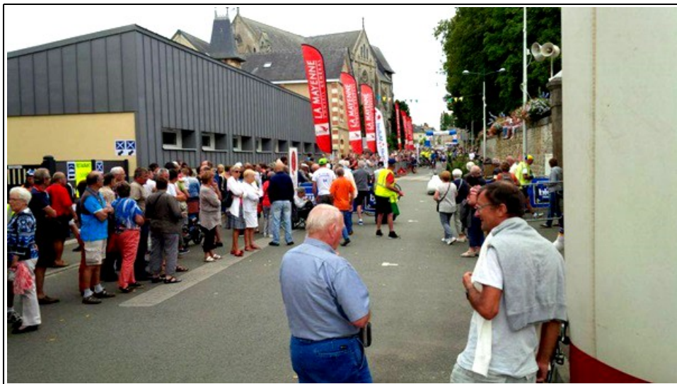
Image ne reflétant pas le commentaire ci-dessus : où sont les randonneurs félicités ? Pas un vélo.

Radio-camping-car-facetedebouc 19 août 2015 18h 30 Arrivée à Villaines-la-Juhel, 18 h 30, c'est la fête dans le village, tous les participants sont chaleureusement encouragés par une foule pas avare de hurras et d'applaudissements !