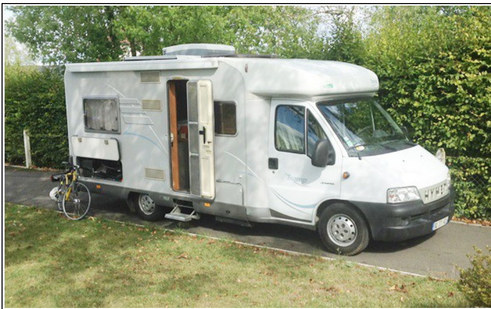
Camping car côté droit