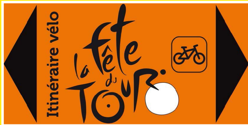
Indication de l'itinéraire recommandé à vélo

Tracé possible à vélo, en voiture ou à pied en suivant le fléchage