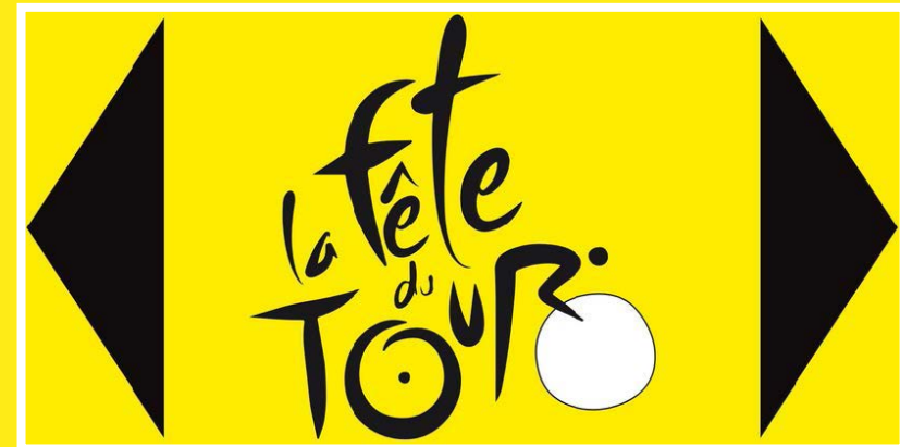
Indication de l'itinéraire de la Fête du Tour